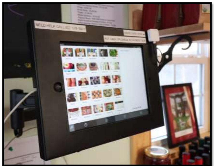
Exemple de fonctionnement à la Ferme coopérative la Charrette