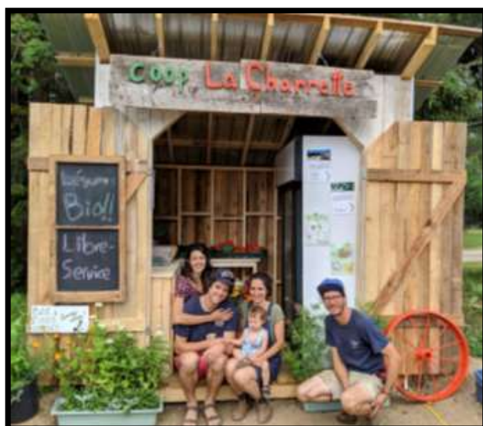
Kiosque simple ouvert avec réfrigérateur