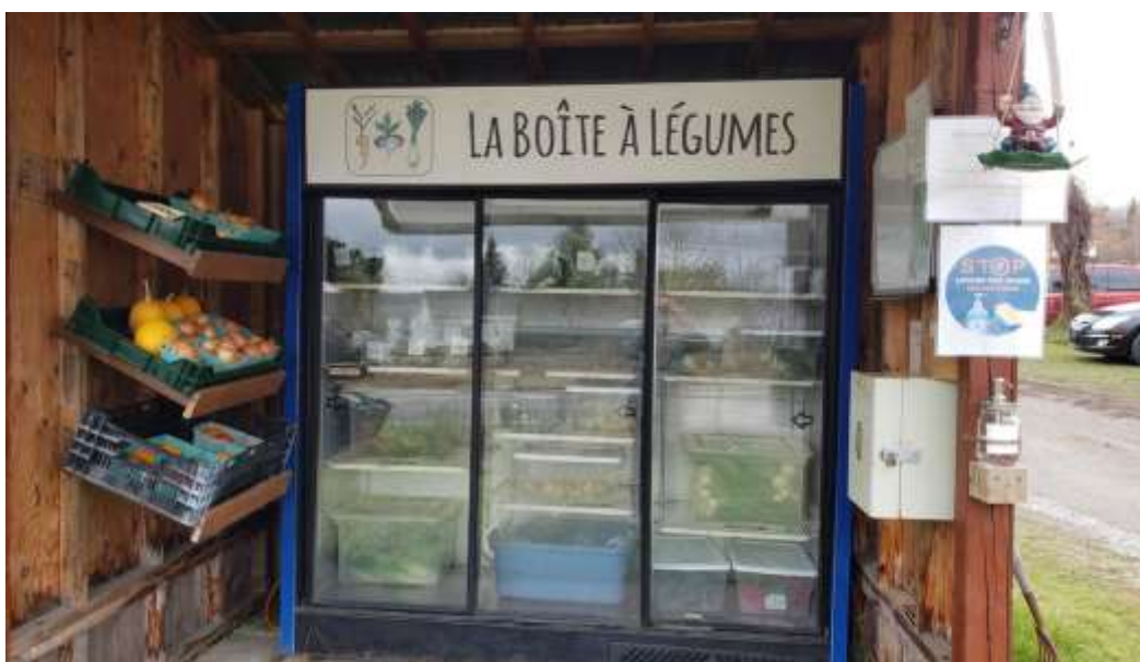
Frigo vitré avec emballage et contenants transparents